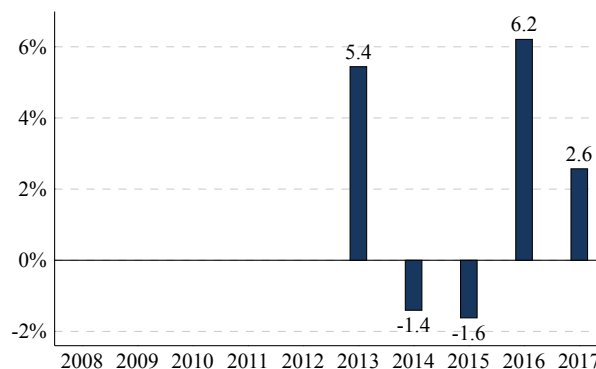
SKY Harbor Global Funds - U.S. Short Duration High Yield Fund F Accumulazione GBP (LU0765419733)

Il risultato (il rendimento) della classe di azioni è calcolato al netto delle spese correnti. Le eventuali spese di sottoscrizione e di rimborso non sono state considerate.