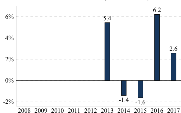
SKY Harbor Global Funds - U.S. Short Duration High Yield Fund F thesaurierend GBP (LU0765419733)

Die Wertentwicklung (Rendite) der Anteilsklasse wird nach Abzug der laufenden Kosten berechnet. Mögliche Ausgabeauf- und Rücknahmeabschläge wurden nicht berücksichtigt.