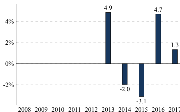
SKY Harbor Global Funds - U.S. Short Duration High Yield Fund F Accumulazione CHF (LU0765419907)

Il risultato (il rendimento) della classe di azioni è calcolato al netto delle spese correnti. Le eventuali spese di sottoscrizione e di rimborso non sono state considerate.