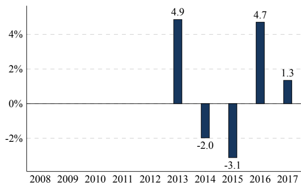
SKY Harbor Global Funds - U.S. Short Duration High Yield Fund F thesaurierend CHF (LU0765419907)

Die Wertentwicklung (Rendite) der Anteilklasse wird nach Abzug der laufenden Kosten berechnet. Mögliche Ausgabeauf- und Rücknahmeabschläge wurden nicht berücksichtigt.