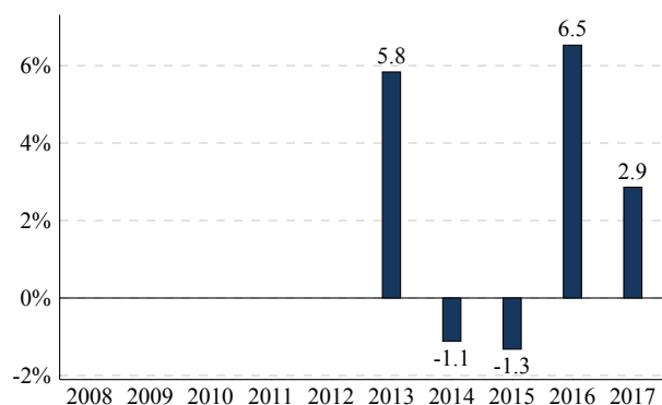
SKY Harbor Global Funds - U.S. Short Duration High Yield Fund B thesaurierend GBP (LU0765418099)

Die Wertentwicklung (Rendite) der Anteilklasse wird nach Abzug der laufenden Kosten berechnet. Mögliche Ausgabeauf- und Rücknahmeabschläge wurden nicht berücksichtigt.