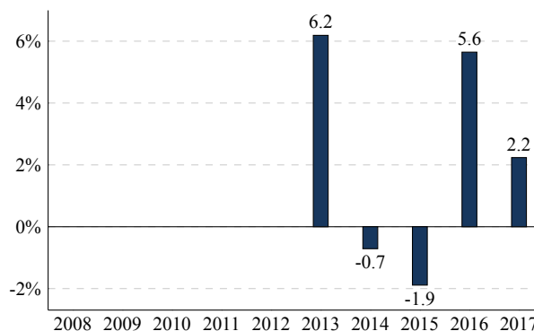
SKY Harbor Global Funds - U.S. Short Duration High Yield Fund A Capitalisation SEK (LU0765417794)

La performance (le rendement) de la catégorie d'actions est calculée après déduction des frais courants. Les possibles frais d'entrée et de sortie n'ont pas été pris en compte.