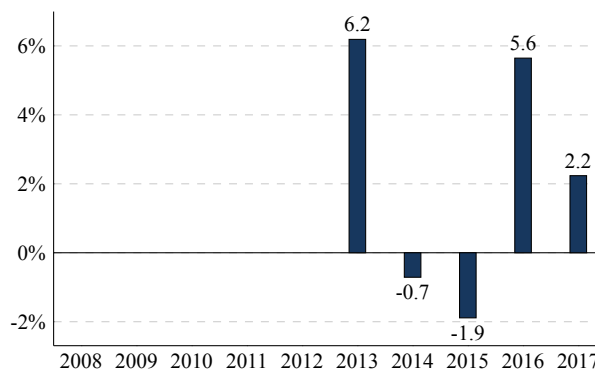
SKY Harbor Global Funds - U.S. Short Duration High Yield Fund A thesaurierend SEK (LU0765417794)

Die Wertentwicklung (Rendite) der Anteilsklasse wird nach Abzug der laufenden Kosten berechnet. Mögliche Ausgabeauf- und Rücknahmeabschläge wurden nicht berücksichtigt.