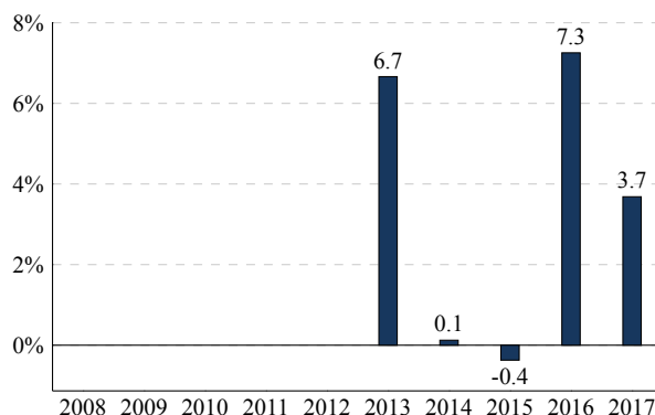
SKY Harbor Global Funds - U.S. Short Duration High Yield Fund A Kapitalisatie NOK (LU0765433999)

Het rendement van de aandelenklasse (opbrengst) wordt berekend na aftrek van de lopende kosten. De mogelijke instap- en uitstapvergoedingen zijn niet in acht genomen.